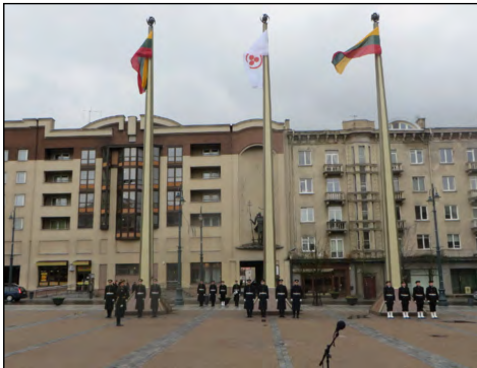
Знамя Мира на флагиштоке перед Сеймом Литвы. Вильнюс, 15.04.2015.