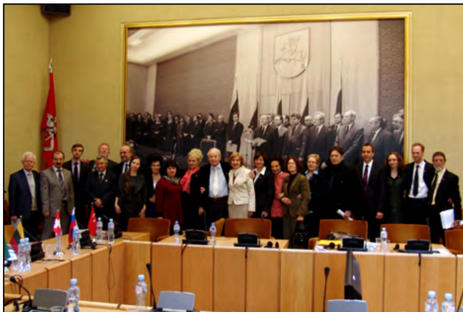
Участники конференции в конференц-зале Сейма Литовской Республики. Вильнюс, 15.04.2015.