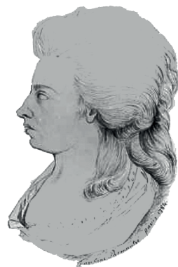
Maria Theresia Paradis, 1784 г.